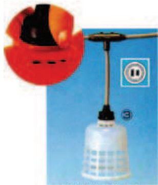
VCT・ゴム防水ソケット