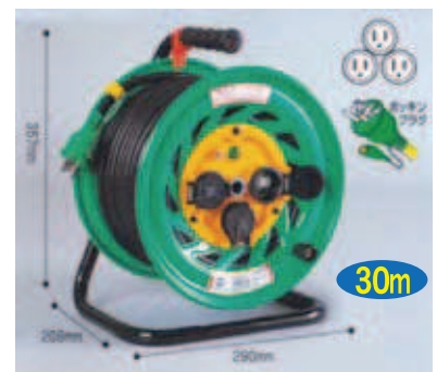
屋外型 FW-E33 VCT2.0 × 3芯 22A