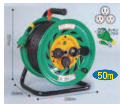
屋外型 FW-E53 VCT2.0 × 3芯 22A

工事看板 バリエード ガラス・工事灯 カラーコーン 方向指示板 回転灯 電光盤・信号機 照明器具・電工ドラム ケーブル カーブミラー 道路標識 その他看板・銘板 消防用品・清掃用品 衛生用品 測量器具・黒板 ホワイトボード 安全保護具 安全標識 環境整備用品 道路用品 安全対策用品・その他