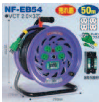
屋内型 NF-EB54 VCT2.0 × 3芯 22A