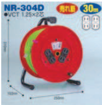
屋内型 NR-304D VCT1.25 × 2芯 22A