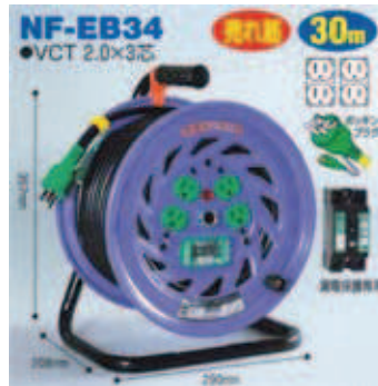
屋内型 NF-EB34 VCT2.0 × 3芯 22A