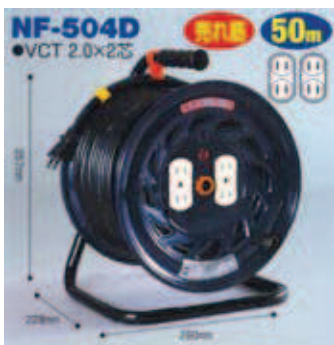
屋内型 NF-504D VCT2.0 × 2芯 22A