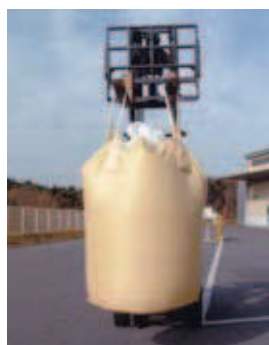
ジャンボ土のう袋