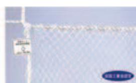
ラッセル安全ネット

●特徴 1. ネットの目や網目が、人体に刺さらず、土塵の落下防止にも効果的です。 2. 全国工業安全認定製品ですので、安心してご利用いただけます。