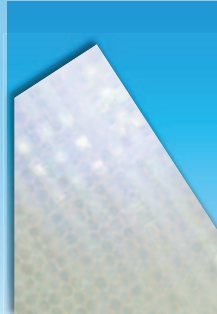
【ダイヤモンドグレード】