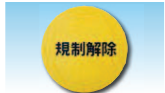
NT-K044 600φ 標識カバー