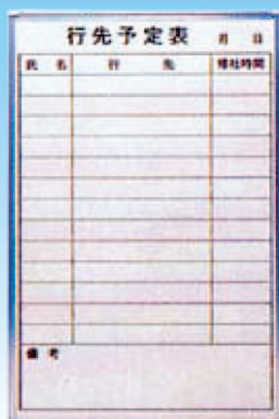
品番 サイズ (W×H) NT-H037-1 600 × 900