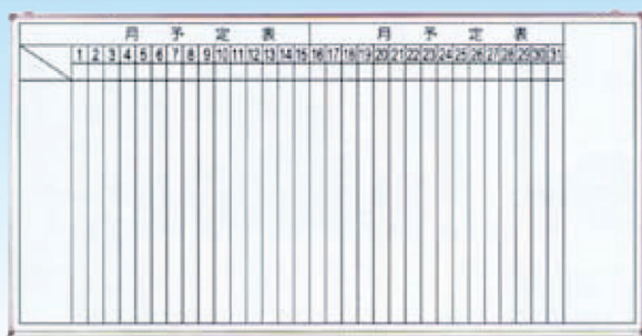
品番 サイズ (W×H) NT-H031 1800 × 900