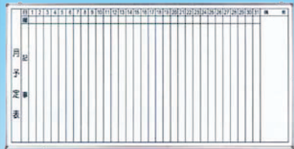
品番 サイズ (W×H) NT-H029 1800 × 900